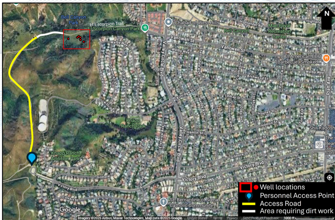
Foto con una vista más cercana del sitio

El mapa muestra el campo petrolero de Canoga Park en West Hills.